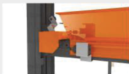
Sistem electric automat de blocare