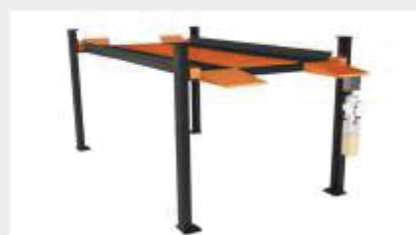
Platforma mai lată ușurează manevrarea și parcare