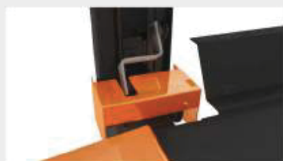
Mecanism unic de detectare a cablului din oțel