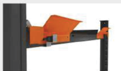
Opritor pentru autovehicule